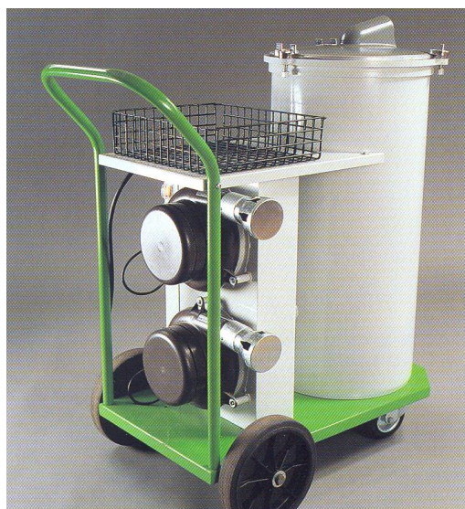
Vue arrière des moteurs jumelés