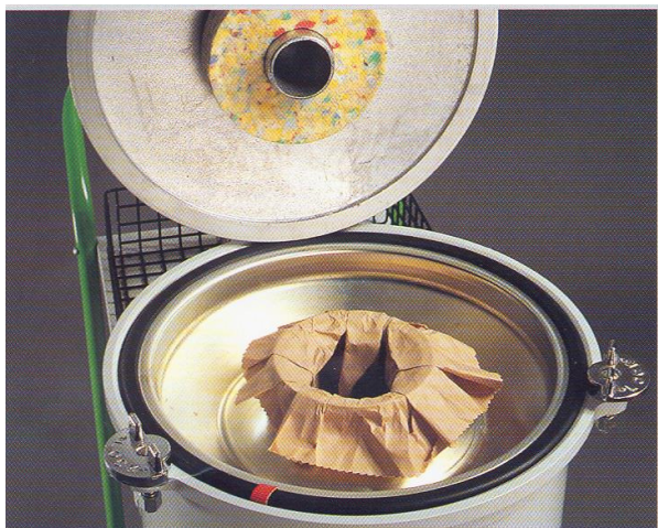
Récupération dans sac papier